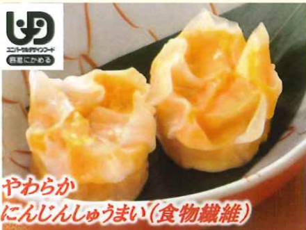
やわらか にんじんしゅうまい (食物繊維)

豆腐と、にんじんを入れたすり身を合わせたやわらかな焼売です。茹でるとよりやわらかくなります。