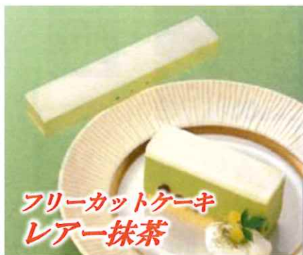
フリーカットケーキ レア抹茶

かのご豆入りの香り 豊かな抹茶ムースと、 ミルク風味のナパージュを 組み合わせた。 和風ケーキです。