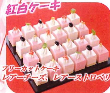
フリーカットケーキ レアチーズ、レアストロベリー