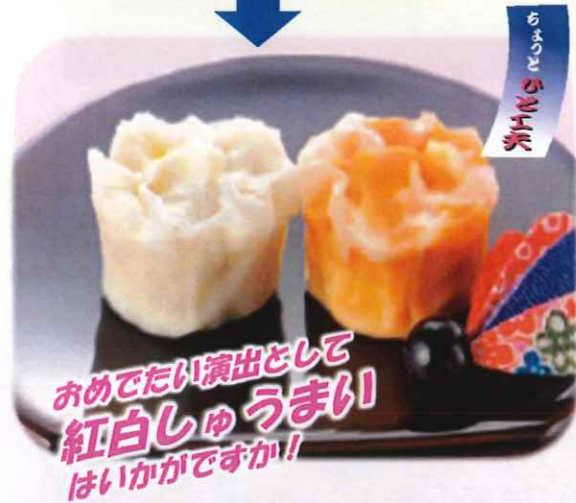
おめでたい演出として 紅白しゅうまい はいかがですか!