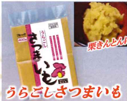
うらごしさつまいも