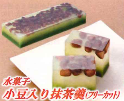
水菓子 小豆入り抹茶羹(フリーカット)