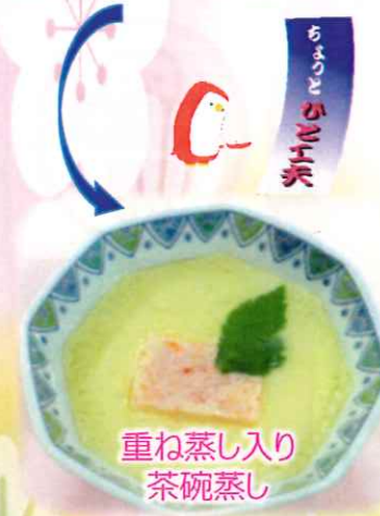
重ね蒸し入り 茶碗蒸し