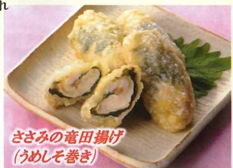
ささみの竜田揚げ (うめしそ巻き)