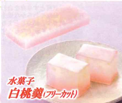
水菓子 白桃羹(フリーカット)