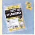
山芋と海老の湯葉包み