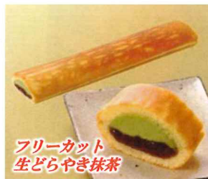
フリーカット 生どらやき抹茶

抹茶ホイップクリーム と粒あんを、ふっくら 軽い生地で挟んだ、 フリーカットタイプの どら焼きです。