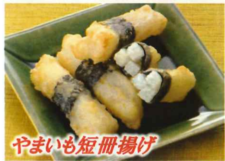
やまいも短冊揚げ