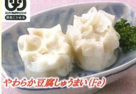
やわらか豆腐しゅうまい (Fe)