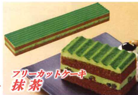
フリーカットケーキ 抹茶